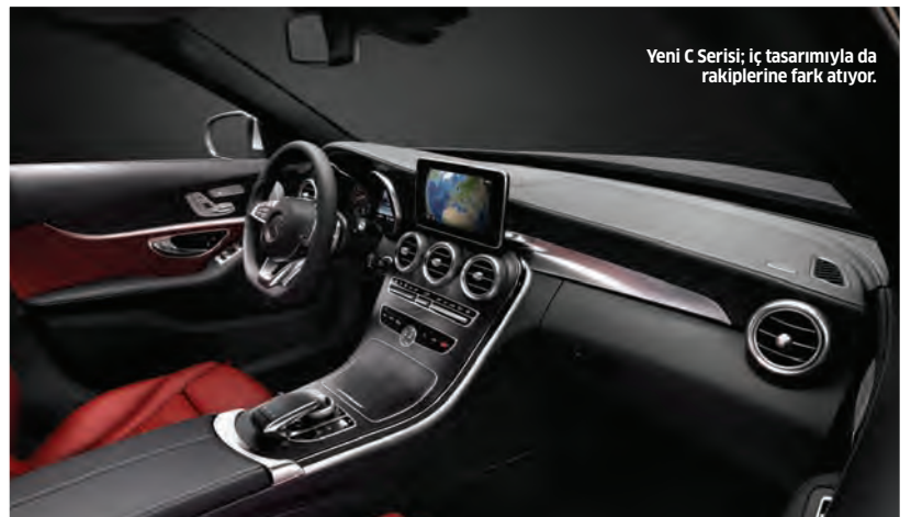
Yeni C Serisi; iç tasarımıyla da rakiplerine fark atıyor.